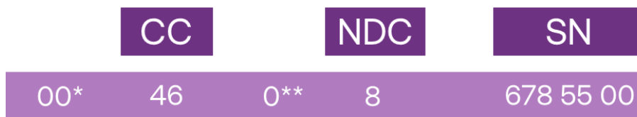
Figur 2 - Som nämnts ovan i avsnitt 1 finns det också prefix. Prefix är inte en del av det internationella E.164-numret. Bl.a. det internationella prefixet 00 (*) och det nationella prefixet 0 (**). Deras placering framgår i figuren ovan. Som exempel används telefonnumret till PTS.

Den maximala nummerlängden vid ett utgående internationellt samtal är 15 siffror inklusive landskoden. Eftersom Sverige har en tvåsiffrig landskod (46) innebär det att den teoretiskt maximala nummerlängden för nationell numrering i Sverige är 0 + 13 siffror (där "0" är det nationella prefixet). Som nämnts ovan räknas varken det internationella prefixet (00) eller nationella prefixet (0) som en del av ett E.164-nummer.