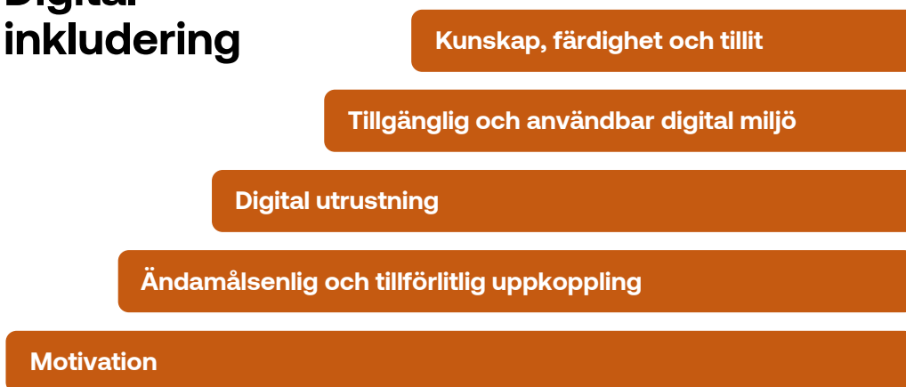
Figur 1. Förutsättningar som är väsentliga för individens möjlighet att vara digitalt inkluderad, Post- och telestyrelsen, 2024.

Samtliga de faktorer för att uppnå digital inkludering som berörs i figur 1, har bärighet på det uppdrag som PTS föreslår. I detta tidiga skede i arbetet med regeringsuppdraget, har det dock inte funnits tid att fördjupa analysen av hur dessa faktorer samspelar med varandra i det större ansvarssammanhang som PTS föreslår i denna promemoria.