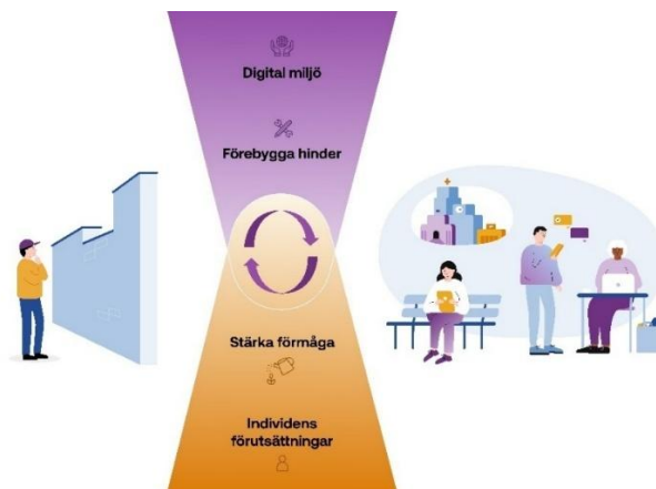
Figur 1. PTS modell för ansvarsfull digital omställning

PTS uppföljning och analytiska ramverk för digital inkludering utgår från en modell för ansvarsfull digital omställning som strukturerar arbetet utifrån två samspelande perspektiv: utformningen av digitala miljöer och individers förutsättningar att använda dem. Modellen visar att digital inkludering kräver samspel mellan individens förutsättningar och tjänsternas utformning. Tillgängliga, användbara och ändamålsenliga digitala tjänster får effekt först när människor har förmåga och möjlighet att använda dem, och goda förutsättningar hos individen räcker inte om tjänsternas utformning brister.